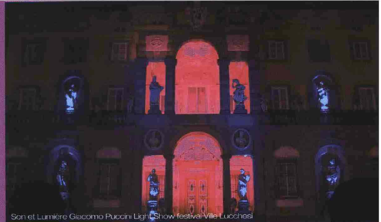
Son et Lumiere Giacomo Puccini Light Show festival Ville Lucchesi

Lighting Design Collection è uno dei media partner dell'iniziativa, insieme a Corriere della Sera, ABITARE, Luce&Design, LUCE e il sito archilight.it . Patrocina-to da AIDI - Associazione Italiana di Illuminazione, e da AIAP - Associazione Italiana Progettazione per la Comunicazione Visiva, il progetto ha poi quali partner Fiera Milano Tech , Urban Solutions, e l'Associazione internazionale L.U.C.I. - Lighting Urban Community International - network che favorisce gli scambi tra le metropoli e i professionisti di diversi paesi per potenziare il settore dell'illuminazione urbana. Partner tecnico di LED UL - Underwriters Laboratories - società leader al mondo in materia di sicurezza e certificazione di prodotto. LED ha chiamato a raccolta tutti i più importanti poli accademici e formativi, sia pubblici che privati, della città. Dalla Facoltà del Design del Politecnico di Milano, all'Accademia di Belle Arti di Brera; dalla Domus Academy allo IED - Istituto Europeo di Design; dalla Naba - Nuova Accademia di Belle Arti Milano, alla SPD - la storica Scuola Politecnica di Design. In scena i giovani talenti e al loro fianco i grandi maestri. Dieci i grandi designer invitati 'fuori concorso' ad aprire la manifestazione: Michele De Lucchi, Fabio Novembre, Paolo Rizzatto, Italo Rota, Paul Cockledge, Alain Guilhot, Akari Lisa Ishii e Carole Ferreri, Gilbert Moity, Patricia Urquiola.